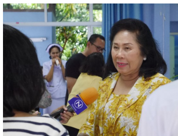
รศ.ดร.ทัศนาศู บุญทอง นายกสภาการพยาบาล ให้สัมภาษณ์เรื่องโครงการดังกล่าวกับสื่อจากช่อง Nation