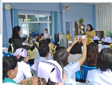
รศ.ดร.ทัศนาศู บุญทอง นายกสภาการพยาบาล กล่าวแสดงความชื่นชมและให้กำลังใจบุคลากรของศูนย์ฯ ที่มุ่งมั่นตั้งใจทำงานเพื่อประชาชน