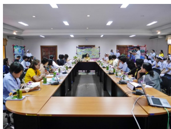
ผู้บริหารสภาการพยาบาลและคณะทำงานโครงการฯ เยี่ยมชมและรับฟังการดำเนินงานระบบการดูแลระยะยาวในผู้สูงอายุของโรงพยาบาลน้ำพอง